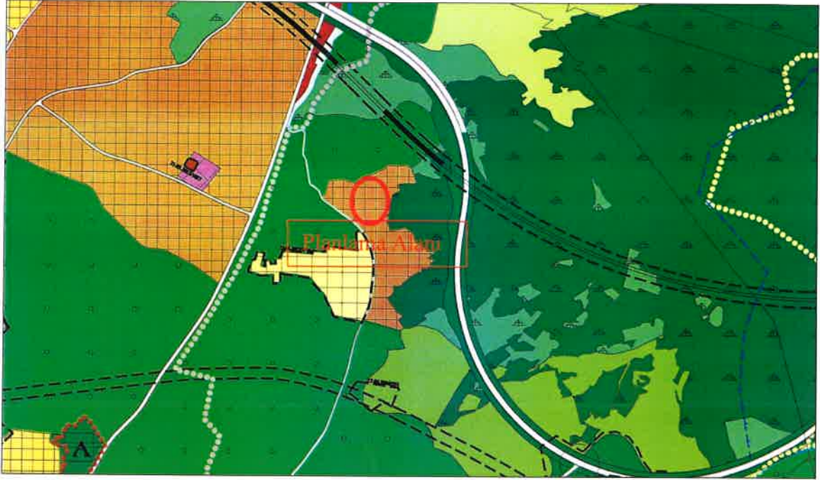
Yürürlükteki Bursa Büyükşehir Belediyesi Merkez Planlama Bölgesi 1/25000 Ölçekli Nazım İmar Planı Revizyonu